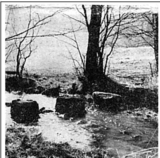
Oberhessische Zeitung v. 20.12.1958 „Brücke ohne Bogen“ im Wannbachtal

Hier am Rande des schildförmigen zentralen Vogelsbergmassives setzen - wie Radspeichen an der Nabe - jene Bäche und Flüsse an, die ihre Wasser nach Nordwesten, nach Norden oder nach Nordosten lenken. Seit Urzeiten nutzten Menschen die zwischen ihnen liegenden Wasserscheiden für ihre Fernwege, wie es für unseren Raum steinzeitliche Streufunde bei Ulrichstein beweisen. Ein noch nicht ganz fertiger frühkeltischer Reibestein, der auf der Umfassungsmauer des Friedhofes gefunden wurde, bezeugt, dass um 600 v. Chr. hier in der Nähe Menschen auch über längere Zeit sesshaft waren.