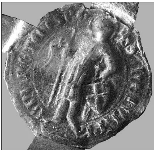
„Etihep.“ (Etihepurg) in Siegelumschrift

In der Markbeschreibung für die Kirche von Zell (a. 825) werden im Bereich des heutigen Meiches die Besitzungen eines Albuin