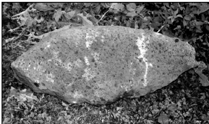
Frühkeltischer Reibestein - Unterlieger, Werkstück

Was machte den Totenköppel so interessant? Das offenbart sich auch dem heutigen Besucher bei einem Blick in die vor ihm ausgebreitete weite Landschaft: Zwischen Amöneburg und Milseburg spannt sich das Rund der schon früh- und vorzeitlich von Menschen besetzten Höhen und lässt ihn dazu gehören!