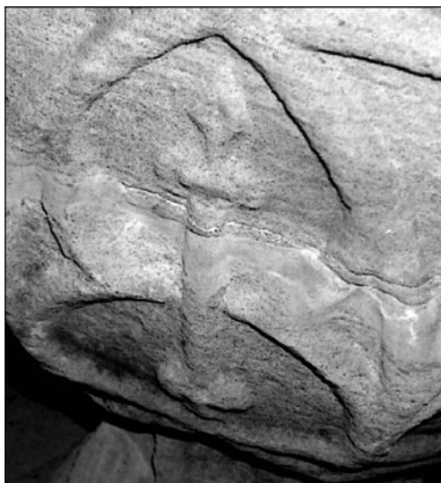
Reichszepter-Darstellung auf dem Taufstein-Kumpf

Noch um das Jahr 1500 war man sich in der Meicheser Kirche der Anbindung an die Reichsgewalt bewusst. Damals ist der spätgotische Taufstein entstanden, auf dem das dargestellte Reichszepter mit der stilisierten Lilie eindeutiger Beweis dafür ist. Geistliche Lehen (Kirchenlehen) waren sogenannte „Zepterlehen“. Im Mittelalter bedurften Rechtsakte weniger der Schriftform als vielmehr formaler Handlungen, um wirksam zu werden. Eine über den Vorgang gefertigte Urkunde war nur begleitender Bericht, keines Falles rechtsbegründend. Der Empfänger des Kirchenlehens nahm das Zepter vorübergehend in die Hand und erhielt damit Verfügungsgewalt über die Kirche. Bei weltlichen Lehen erfolgte die Übergabe mit der Fahne („Fahnlehen“). Bis zur allgemeinen Ablösung der Grundlasten im 19. Jh. ruhte auf zahlreichen Grundstücken der Meicheser Gemarkung eine besondere (Reichs-)Steuer, der (oder auch die) medem, met-humb: das sogenannte „siebte Seil“, eine Abgabe, die ursprünglich dem König zustand.